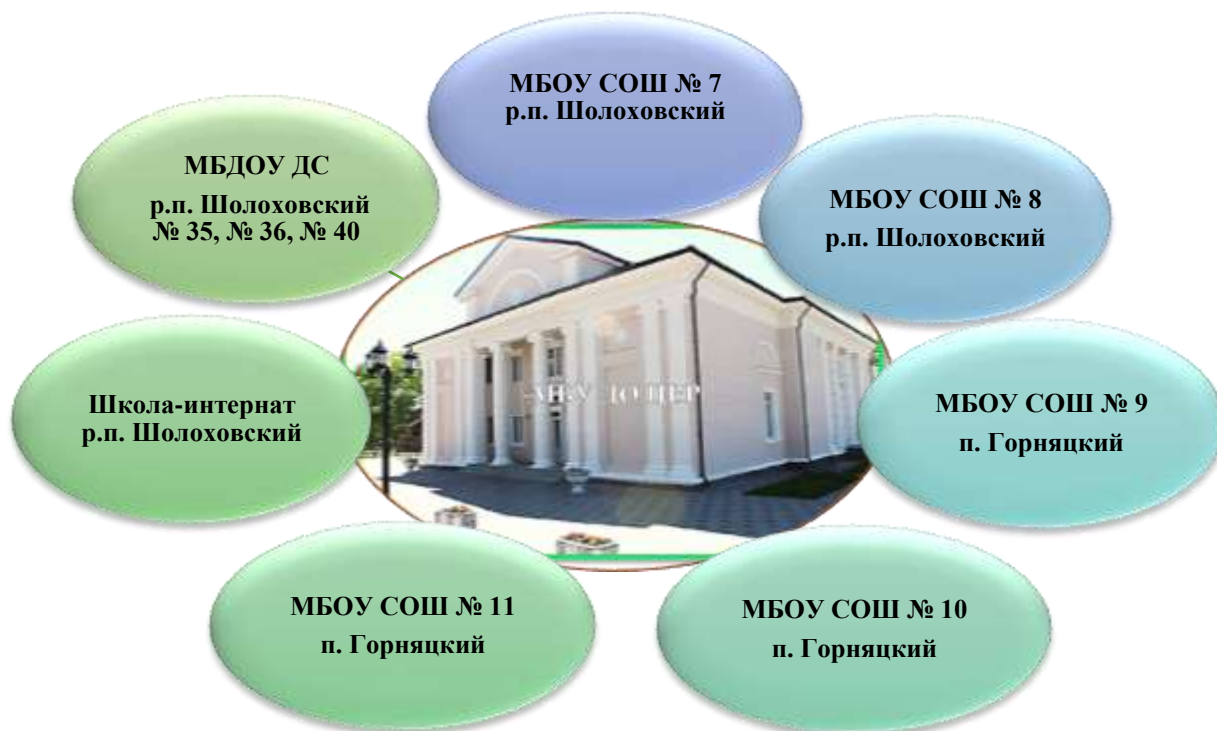
Рис. 3. Сотрудничество МБУ ДО ЦВР.

Сотрудничество Центра с перечисленными образовательными организациями оформлено соответствующими договорам).