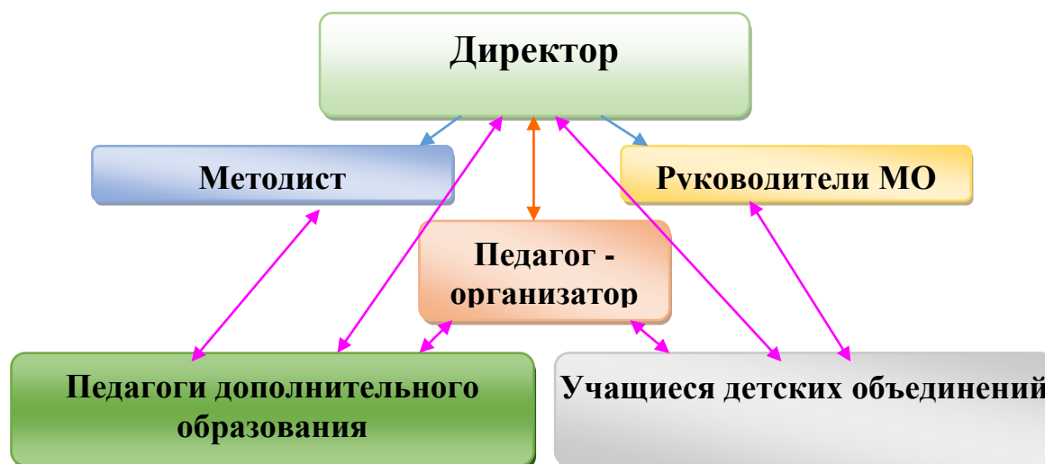
Рис.1. Структура управления МБУ ДО ЦВР

Директор - организует работу Центра и несет полную ответственность за все направления его деятельности, руководит работой педагогического совета, осуществляет контроль за выполнением дополнительных образовательных программ.